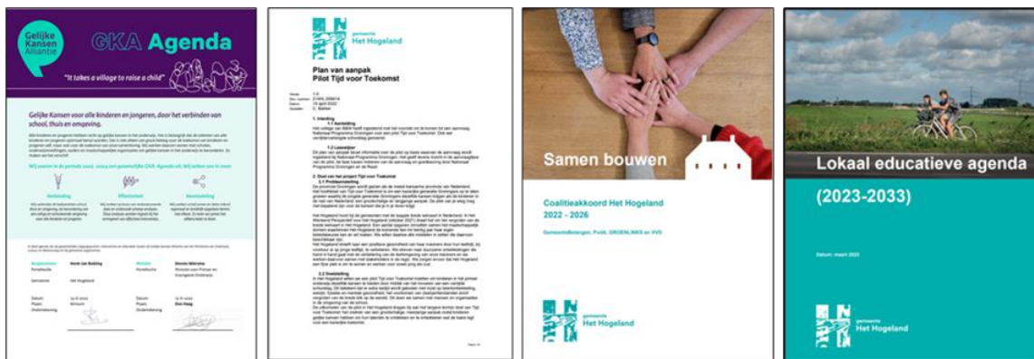
Gelijke Kansen Agenda

Voor NSMV met de regio als klaslokaal heeft gemeente Het Hogeland verschillende beleidsafspraken die de ontwikkeling van de aanpak niet alleen op korte maar ook op lange termijn borgen. Ook op provinciaal niveau is NSMV met de regio als klaslokaal beleidsmatig gefundeerd en geborgd in onderstaande beleidsplannen: